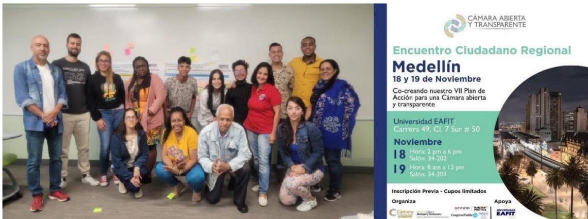
Imagen 1. Encuentro ciudadano regional Antioquia.

Los espacios de cocreación se realizaron entre el 18 de noviembre del 2022 al 26 de noviembre del 2022 en las ciudades de Medellín, Barranquilla y Cali.