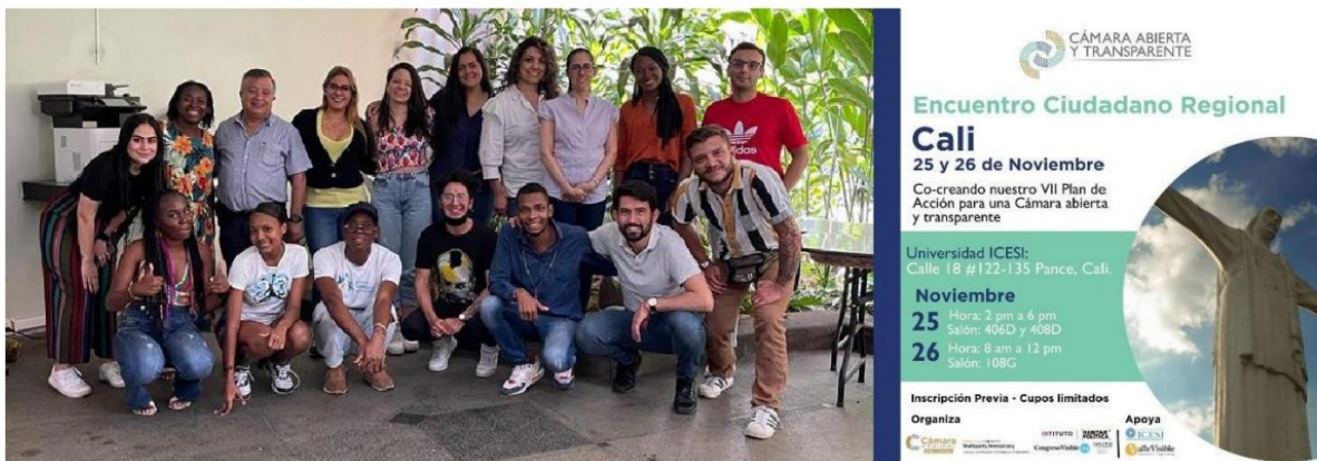
Imagen 3. Encuentro ciudadano regional Valle.

Como resultado, se realizó la sistematización y unificación de la información recolectada en los espacios de cocreación en una matriz que recoge los pasos expuestos en la metodología. 1 De esta manera, se incorporó lo discutido con la ciudadanía y se consolidó la matriz final que compone el Séptimo plan de Acción para una Cámara moderna, abierta y transparente (2022-2023). 2 A continuación, se presentan los componentes con sus respectivas actividades.